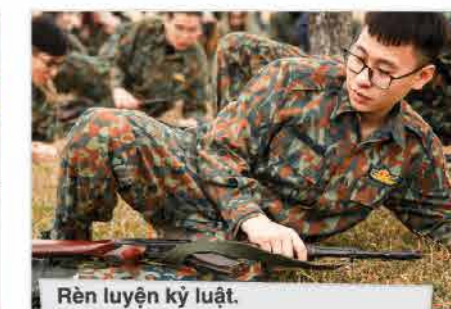
Rèn luyện kỷ luật. Tôi luyện ý chí. Vươn tới mục tiêu.