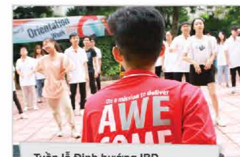
Tuần lễ Định hướng IBD