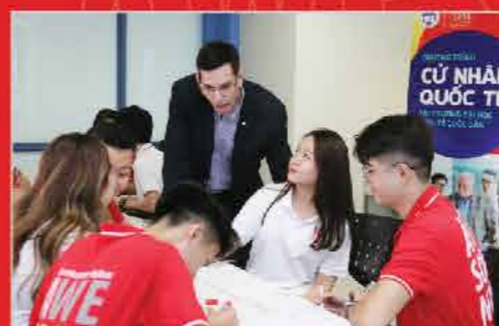
Giáo viên nước ngoài