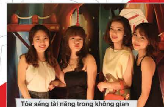
Tỏa sáng tài năng trong không gian thanh lịch và sang trọng.