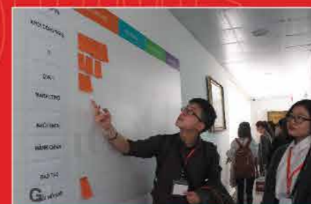
Trải nghiệm thực tế tại doanh nghiệp