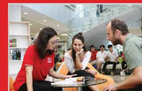
Cơ hội giao lưu & trao đổi sinh viên quốc tế