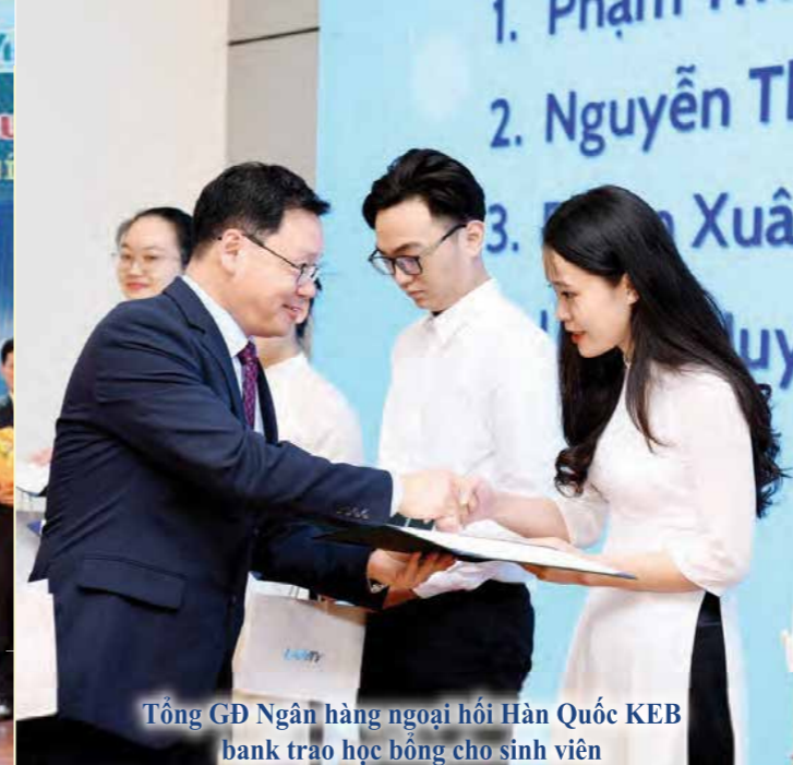
Tổng GD Ngân hàng ngoại hối Hàn Quốc KEB bank trao học bổng cho sinh viên