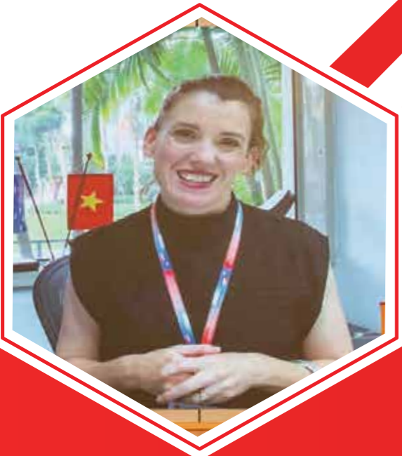
Đại sứ quán Úc phát biểu chúc mừng tại lễ ký kết

+ Một văn bằng với 2 chuyên ngành Tài chính và Quản lý, được cấp bởi Đại học La Trobe - Úc, có giá trị toàn cầu, Bộ Giáo dục và Đào tạo Việt Nam công nhận.