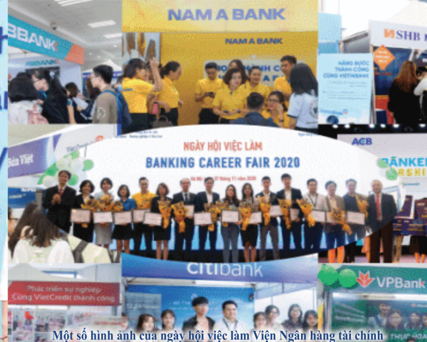
Một số hình ảnh của ngày hội việc làm Viện Ngân hàng tài chính